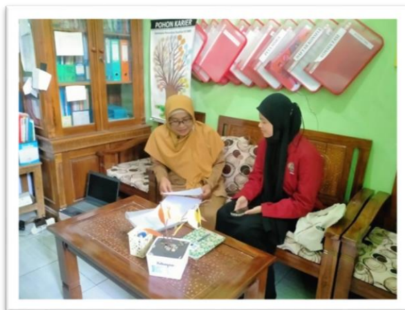
Gambar 7. Wawancara dengan guru Bimbingan Konseling