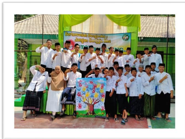
Gambar 2 dan 3. Pelaksanaan Deklarasi anti-Bullying