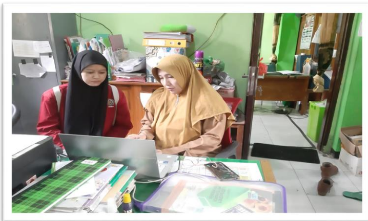
Gambar 6. Wawancara dengan guru Pendidikan Agama Islam