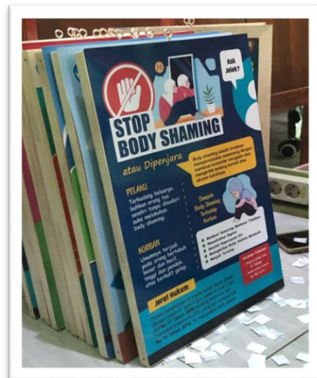
Gambar 4 dan 5. Buku Konseling Siswa dan Poster anti-bullying