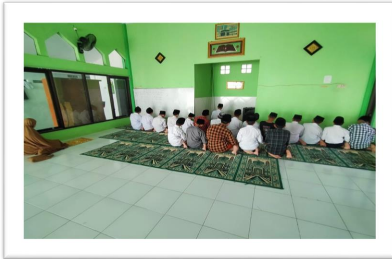
Gambar 1. Sholat Dhuhur berjamaah